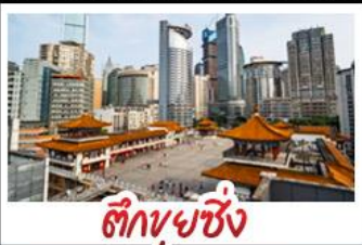
ตึกขุยซิ่ง

พระแกะสลักหินต้าจู้ - หลุมฟ้าสะพานสวรรค์ - เขานางฟ้า ตึกขุยซิ่ง - ตึกตะเกียบ หมู่บ้านโบราณฉือซีไห่