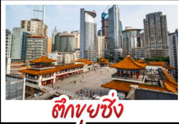
ตึกขุยซิง

พระแกะสลักหินต้าจู้ - หลุมฟ้าสะพานสวรรค์ - เขานางฟ้า ดึกขุยซิง - ดึกตะเกียบ หมู่บ้านโบราณฉือซีโจว