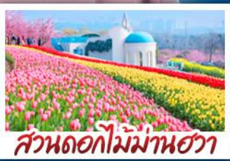
สวนดอกไม้บ้านฮวา