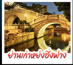
ย่านก้าแซงซังฟาง