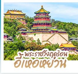
พระราชวังฤดูร้อน อีเซอเฉียวาน