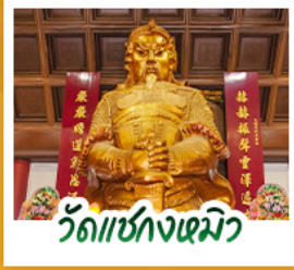
วัดเข่งหนิว