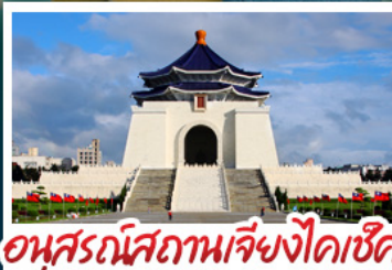
อุทยานสถานเจิ้งโกวเซ็ก