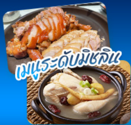
เมนูระดับมิชลิน

เดินทาง | 02 - 07 ก.ย. 69 20 - 25 ส.ค. 69 | 17 - 22 ก.ย. 69