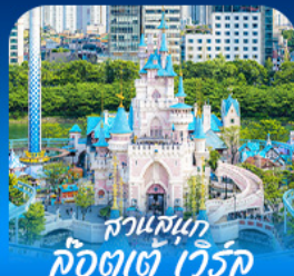
สวนสนุก คีอิตาเต้ เวิร์ด