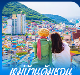
หมู่บ้านดัมซอน