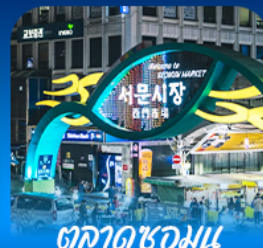
ตลาดชอุมัน