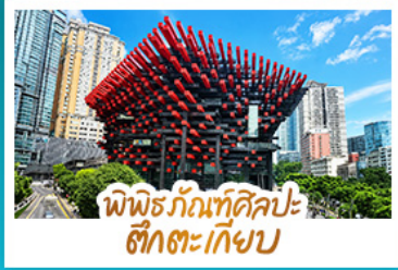
พิพิธภัณฑ์ศิลปะ สักตะเกียบ