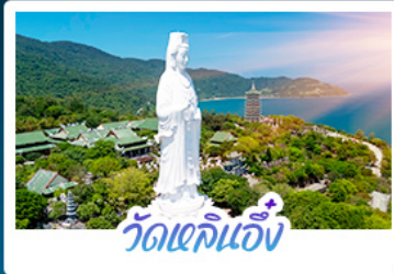
วัดเขลินเอ็ง