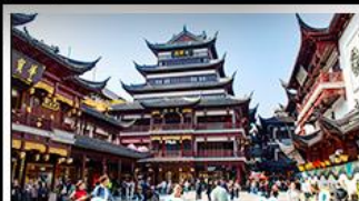
ตลาดร้อยปีเจิ้งหวงเหมียว