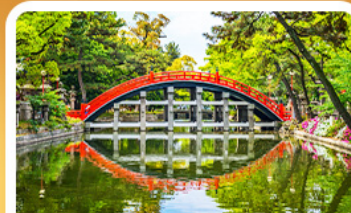
ศาลเจ้าสุมิโยชิ โกเบ