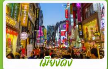
เมียงงดง