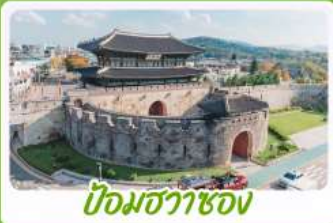
ป้อมข้าราชอง