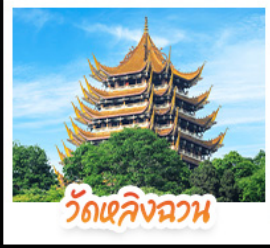
วัดเลิ่งฉวน