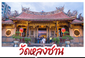
วัดเลงซาน