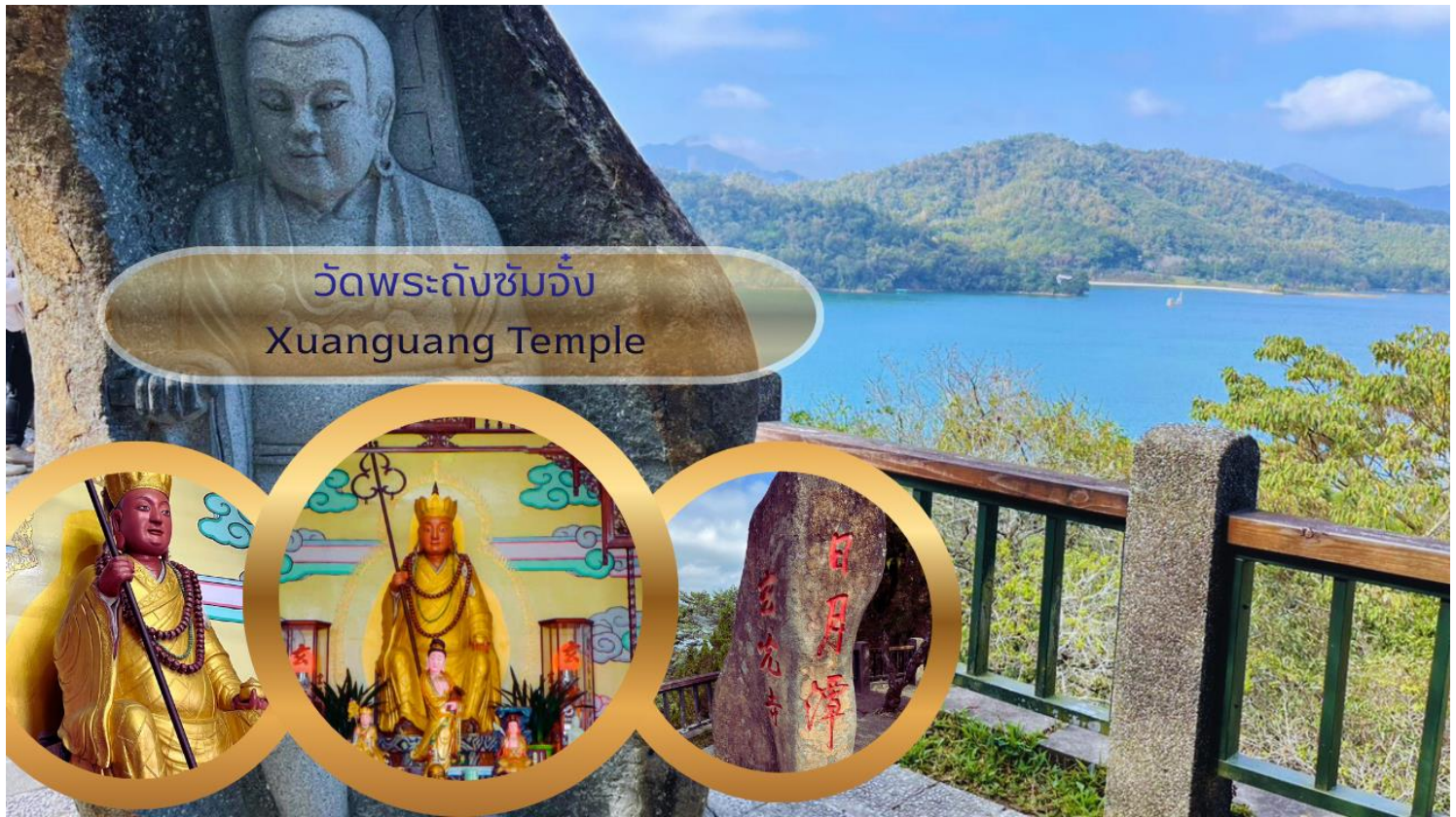
วัดพระถังซำจั๋ง Xuanguang Temple

นำท่านเดินทางสู่ วัดเหวินหวู่ Wenwu Temple หรือ วัดกวนอู ตั้งอยู่ระหว่างเขาทางทิศเหนือของทะเลสาบสุรียันจันทรา สร้างขึ้นเมื่อปี ค.ศ. 1938 ภายในวัดมีรูปปั้นของขงจื้อและเทพกวนอู (เทพเจ้าแห่งปัญญา และเทพเจ้าแห่งความซื่อสัตย์) ซึ่งชาวไต้หวันเชื่อกันว่า หากได้บูชาเทพเจ้ากวนอู จะได้ประสบความสำเร็จในหน้าที่การงาน มีแต่คนจงรักภักดี หรือหากวางแผนสิ่งใด ก็จะได้ประสบความสำเร็จตามปรารถนา เป็นวัดศักดิ์สิทธิ์อีกแห่งหนึ่งของไต้หวัน แต่เดิมในอดีตริมฝั่งทะเลสาบสุรียันจันทราเป็นที่ตั้งของ 2 วัดเก่า คือวัดหลงฟิง Longfeng Temple และวัดหัวถั่ง Huatang of Shuishotsun ชาวบ้านกล่าวว่าน้ำจากทะเลสาบสุรียันจันทรา จะทะลักเข้ามาท่วมวัดหลงฟิงและวัดหัวถั่ง จึงสร้างวัดเหวินหวู่ขึ้น แล้วรวมวัดทั้งสองแห่งไว้ในวัดเหวินหวู่เพียงแห่งเดียว และสร้างกำแพงให้แข็งแรงยิ่งขึ้น เพื่อรับมือกับน้ำจากทะเลสาบสุรียันจันทราที่หนุนขึ้นสูง ในปัจจุบัน สถาปัตยกรรมของวัดนี้เต็มไปด้วยงานแกะสลักหินจำนวนมาก รวมถึงสิงโตหินอ่อน 2 ตัว ที่ตั้งอยู่บริเวณด้านหน้าของวัดซึ่งมีมูลค่าตัวละ 1 ล้านบาทโดยตัวใหญ่แบ่งออกเป็นสามชั้นและมีวิหารเล็กโอบล้อมอยู่ด้านข้าง และเป็นจุดชมวิวที่สวยงามอีกแห่งหนึ่งของทะเลสาบสุรียันจันทราอีกด้วย