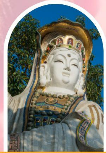
ริพลัสเบย์ รับพลังงานดี เสริมพลังฮวงจุ้ย