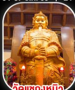
วัดเขกเหมิว

วัดเขกเหมิว- วัดเจ้าแม่กวนอิมฮ่องกง พระใหญ่ไผ่หลิน + กระเช้าแองปัง เมนูสุดพิเศษ!! ต้มชาฮ่องกง บุฟเฟ่ต์ชาบูสไตล์ฮ่องกง และห่านย่าง อิสระท่องเที่ยวดิสนีย์แลนด์ 1 วัน เลือกซื้อบัตรดิสนีย์แลนด์หรือช้อปปิ้งจุใจ