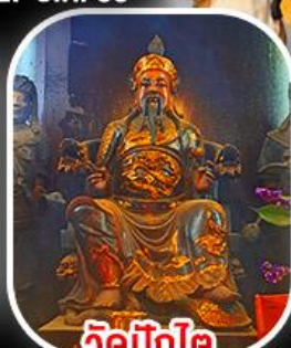
วัดทิ่กโต