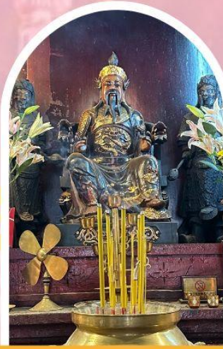
วัดปักไต้ฮ่องกง