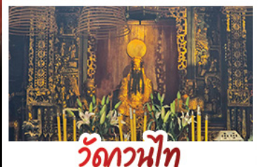
วัดกวนไท้

2UMFM-NX002 | 4 วัน 3 คืน | AIR MACAU | !เมนูพิเศษ! | ซีฟู้ด, เป้าฮ้อ+ไวน์แดง | 2 สวนสนุกเขมร