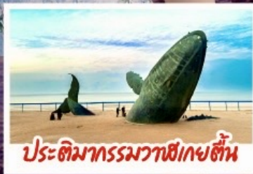
ประติมากรรมวาฬเกยตื้น