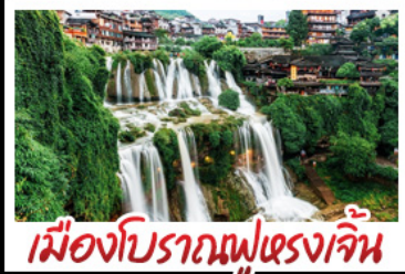
เมืองโบราณผู่แรงเงิน