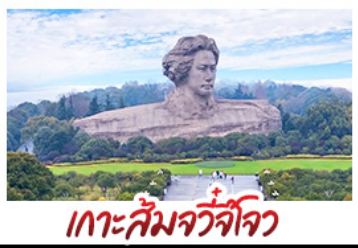
เกาะสัมจิวโจว