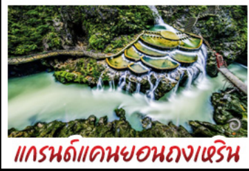
แกรนด์แคนยอนหลงเหิน

เขาฟ้าหิม - เมืองโบราณผู่แรงเงิน เมืองโบราณเพ็งหวง - เกาะสัมจิวโจว แกรนด์แคนยอนหลงเหิน - ไม่เข้าร้านช้อปปิ้ง พักโรงแรม 5 ดาว - รถไฟความเร็วสูง