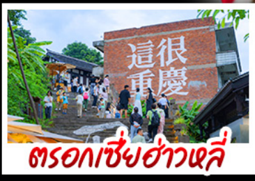
ตรอกซี้ซ่าวหลี่