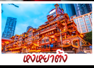
ตงเฉยาดัง