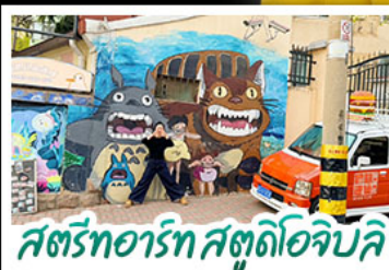
สตรีทอาร์ต สตุตโตโอจิบลิ