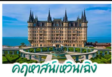
คฤหาสน์หวนเจิง

เมืองเก่าซิงเต่า - คฤหาสน์หวนเจิง เบียร์ซิงเต่า + อาหารทะเล สตรีทอาร์ต สตุตโตโอจิบลิ