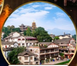
เมืองโบราณฉือฉีไป๋