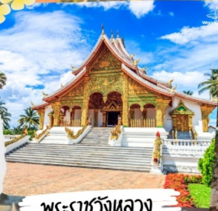
พระราชวังหลวง