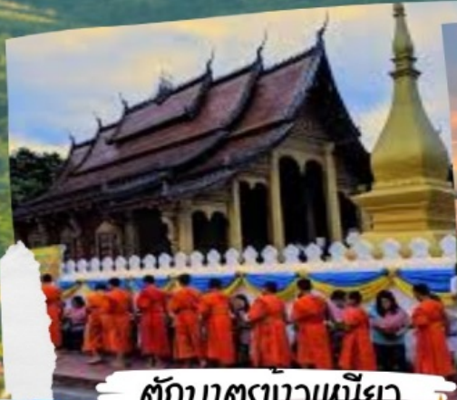
ตักบาตรข้าวเหนียว

กัรันตรีดำตัวเครื่องบินท่านละ 5,000 บาท เดินทางได้ทุกวันยกเว้นวันที่ 25/12 - 5/1 ของทุกปี