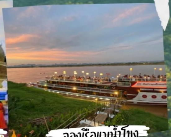
ล่องเรือแม่น้ำโขง