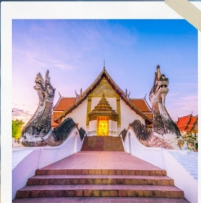
วัดกุสินทร์