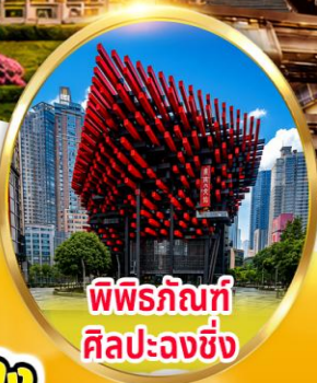
พิพิธภัณฑ์ ศิลปะฉงชิ่ง