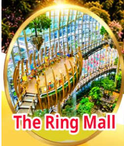
The Ring Mall

เปิดมิติใหม่แห่งมหานครฉงชิ่ง เช็กอินแลนด์มาร์กสุดล้ำ เที่ยวสบายสไตล์คนรุ่นใหม่