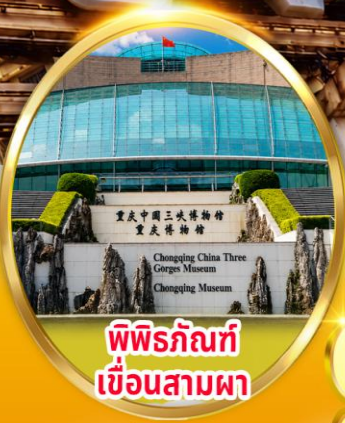
พิพิธภัณฑ์ เขื่อนสามผา