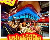
บุฟเฟ่ต์ซีฟู้ด