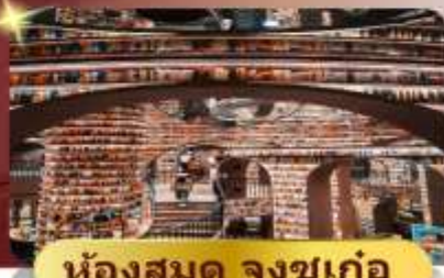
ห้องสมุด จงซูเก๋อ