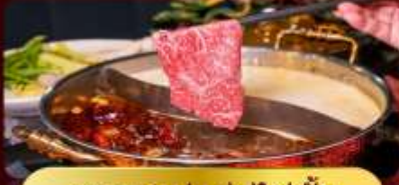
ชาบูหม่าล่าไม้อัน