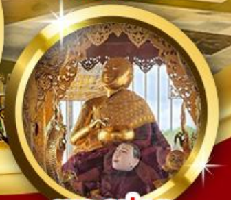
พระอุปคุต