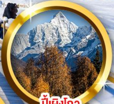
ปี้เิงโกว