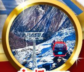
ต่ากู่ปิงชวณ

“เียน 3 อุทยานระดับโลก” พินหิมะต่ากู่ สีดรุณี ปี้เิงโกว ต่ากู่กลาเชียร์ (รวมรถอุทยาน+กระเช้าขึ้น-ลง) แะภาพแพนด้าเซลฟี่ ตะลุยซุนซีลู่