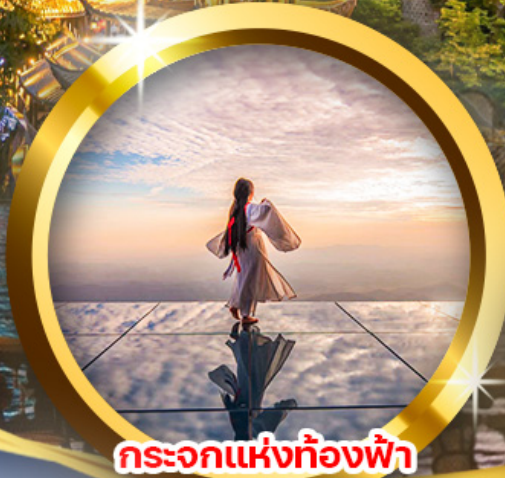
กระบอกแห่งท้องฟ้า