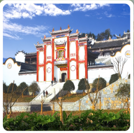
บ้านเกิดชวีหยวน