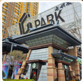
ห้าง G Park