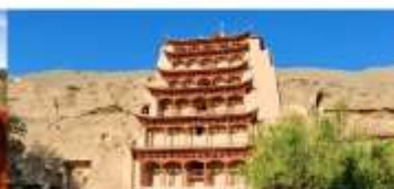
ถ้าแกะสลักม่อเถาคุ