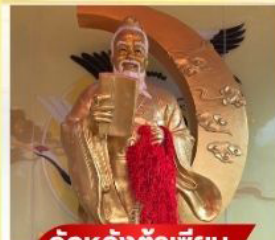
วัตต์หวังต้าเซียม