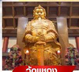
วัดเขากง