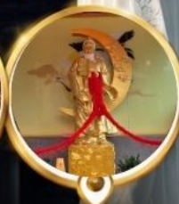
วัดหวังต้าเซียน วอพรความรัก