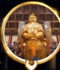
วัดแชกง วอพรโซคลาก