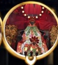
วัดเจ้าแม่กวนอิมฮ่องกง วอพรสุกภาพ