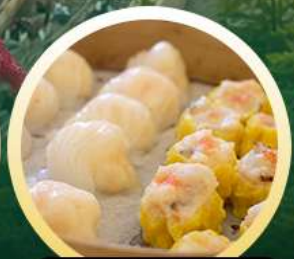
ตี๋มซ่าฮ่องกง