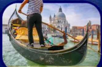
เที่ยวเกาะเวนิส