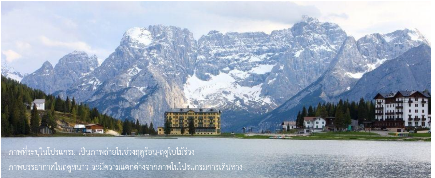
ภาพที่ระบุในโปรแกรม เป็นภาพถ่ายในช่วงฤดูร้อน-ฤดูใบไม้ร่วง ภาพบรรยากาศในฤดูหนาว จะมีความแตกต่างจากภาพในโปรแกรมการเดินทาง