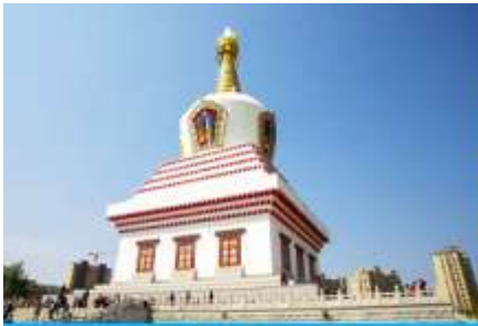
พระเจดีย์เป่าเอ๋อหับ