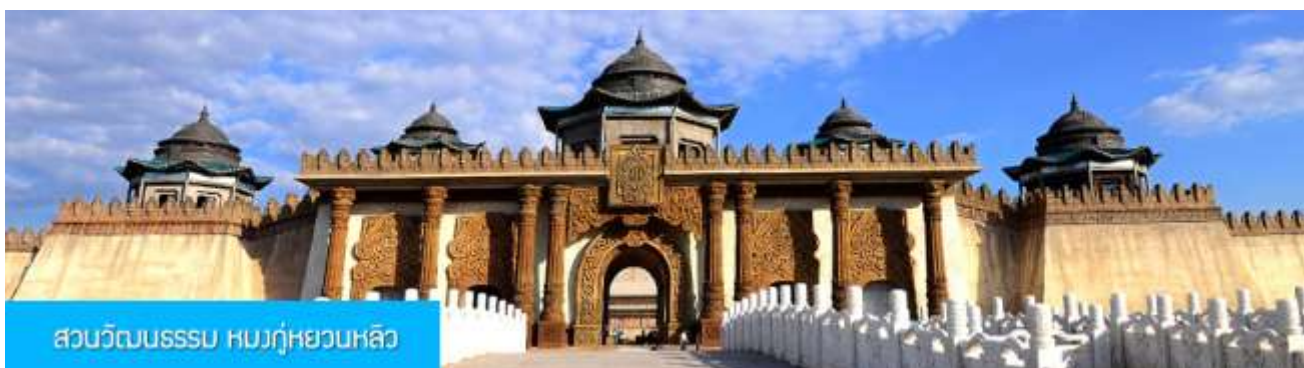
สวนวัฒนธรรม หมงกู่หยวนหลิว

หลังอาหารนำท่านเดินทางกลับเมืองเออร์ดอส (ระยะทาง 144 กม. ใช้เวลาเดินทางราว 2 ชั่วโมงเศษ)