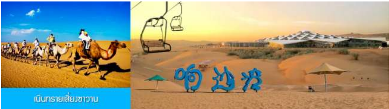
เนินทรายเสียดงชาน

หลังอาหารนำท่านเที่ยวชม เนินทรายเสียดงชาน 响沙湾 แหล่งท่องเที่ยวระดับ 5A กลางทะเลทรายที่ขึ้นชื่อ ของเออร์ดอส เป็นเนินทรายขนาดใหญ่ที่มีรูปทรงดูพระจันทร์เสี้ยว โอบล้อมด้วยเนินทรายราวกำแพงที่ล้อม แอ่งกระทะ ทำให้เกิดเสียงสะท้อนจนเป็นที่มาของชื่อ เสียดงชาน หมายถึงอ่าวทะเลทรายที่มีเสียง หรือที่รู้จักใน นาม อ่าวทรายร้องเพลง ที่ไม่ใช่เป็นเพียงทะเลทรายทั่วไป แต่ยังเป็นปรากฏการณ์ธรรมชาติที่น่าพิศวง เมื่อท่าน ป็นขึ้นเนินทรายแล้ว ไถลตัวลงบนเนินทราย หรือแม้แต่สายลมพัดผ่านเนินทราย มวลเม็ดทรายจะเสียดสีกันจน เกิดเป็นเสียงก้องกังวาน บ้างก็คล้ายเสียงเข็มนาฬิกา บ้างก็คล้ายเสียงฟ้าร้อง ปรากฏการณ์ทรายร้องเพลงนี้ ยังคง เป็นปริศนาที่นักธรณีวิทยาค้นหาคำตอบ มีการเล่าขานในหมู่พื้นเมือง ว่า ณ ที่แห่งนี้เคยมีวัดตั้งอยู่ แม้จะถูกพายุ ทรายกลบฝังไปนานแล้ว แต่ยังคงมีเสียงสวดมนต์ของพระลามะในวัดดังกึกก้องในพื้นทราย.... (ค่าทัวร์รวม กระเช้า รวมผ้าห่มรองเท้า รวมค่าไข่อูฐ)