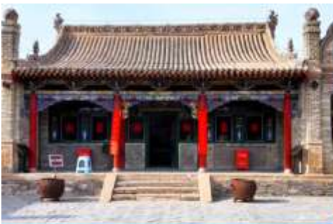
จวนอ่องจวินหวัง

เที่ยง รับประทานอาหารกลางวัน ณ ภัตตาคาร (14)