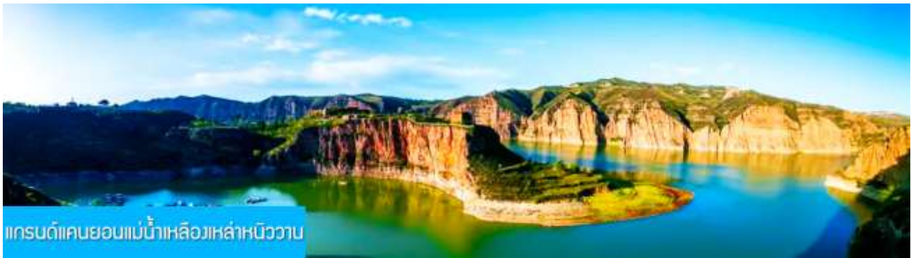
แกรนด์แคนยอนแม่น้ำเหลืองเหล่าหนิววาน

พักที่ ORDOS BOYU AIRUI HOTEL โรงแรมระดับ 4 ดาวท้องถิ่น หรือเทียบเท่าในเมืองเอ้อร์คอส