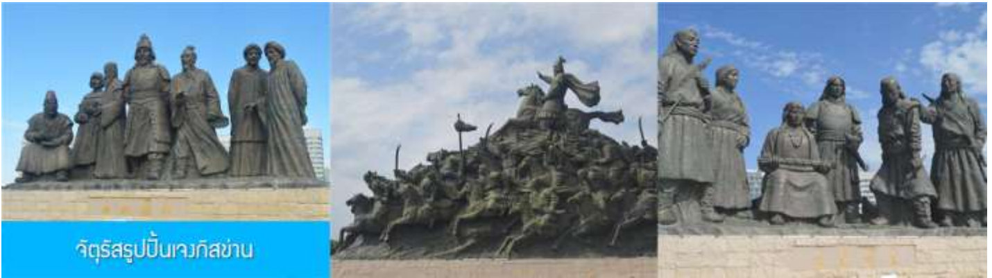
จัตุรัสรูปปั้นเจงกิสข่าน

สมบูรร์ โครงสร้างทำด้วยอิฐ หิน และไม้ ประกอบด้วยห้องพัก 16 ห้อง เป็นสถาปัตยกรรมผสมแบบมองโกล ทิเบต และฮั่น