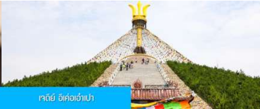
เจดีย์ อี้เค่ออ่าเป่า