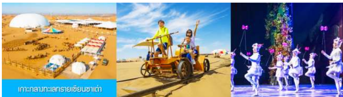
เกาะกลางทะเลทรายเข็มนาเต่า