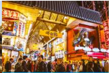
ถนนสตรีทฟู้ดเหม่ยตี้เจีย

นำท่านเที่ยวชม พระเจดีย์เป่าเอ๋อหับ 宝尔汗佛塔 สร้างขึ้นในปี ค.ศ. 2008 สูง 81.6 เมตร ตั้งอยู่ในสวนน้ำพุวี เฉียนโจกกลางเมือง โฮฮอต ภายในประดิษฐานพระบรมสารีริกธาตุของพระพุทธเจ้า และอัฐิของพระอาจารย์ รวมทั้งพระพุทธรูป พระคำภีร์