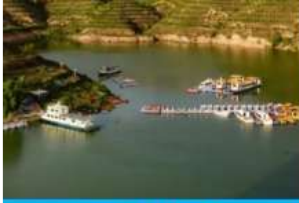
ล่องเรือในแม่น้ำเหลือง