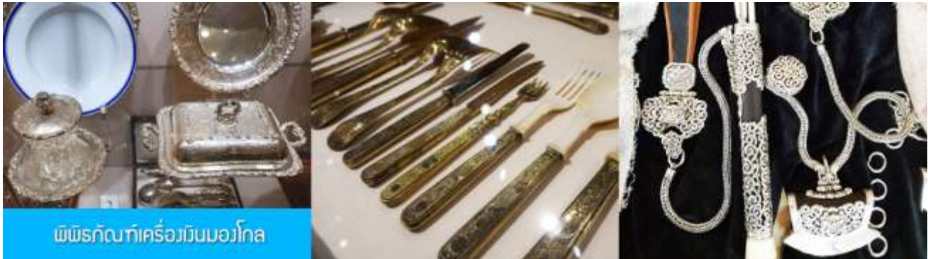
พิพิธภัณฑ์เครื่องเงินมองโกล

รับประทานอาหารเช้า ณ ห้องอาหารของโรงแรม (10)