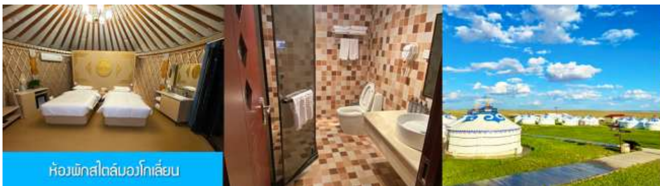
ห้องพักสไตล์มอโกลเลียน