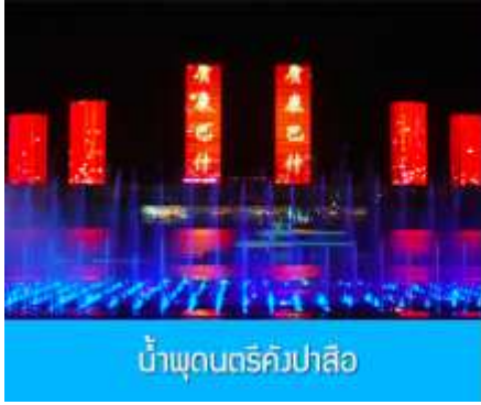
น้ำพุดนตรีคังปาสื่อ