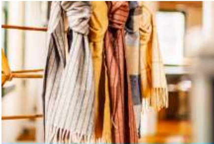
ศูนย์จำหน่ายผลิตภัณฑ์เส้นใยขนอูฐ

หลังอาหารนำท่านเดินทางสู่เมืองเออร์ดอส (ระยะทาง 104 กม. ใช้เวลาเดินทางราว 2 ชั่วโมง)