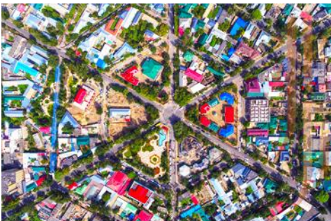
ถนนหกเหลี่ยม

จากนั้นนำท่านเดินทางสู่ เมืองอิหนิง 伊宁 (ระยะทาง 200 กม. ใช้เวลาเดินทางราว 3 ชั่วโมง)