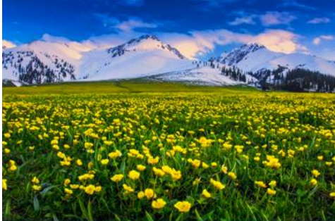
ทุ่งหญ้าลอยฟ้านาลาตี

พักที่ WAN SEN HOTEL ระดับ 4 ดาวท้องถิ่นในตำบลนาลาตี