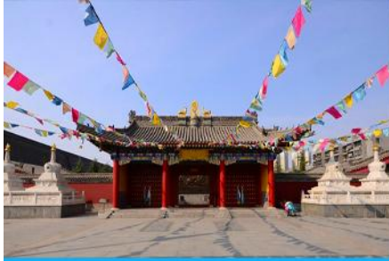
วัดลามะ:กว๋างเหริน