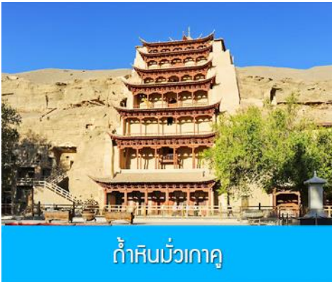
ถ้ำหินมั่วเกาคุ

เช้า รับประทานอาหารเช้า ณ ห้องอาหารของโรงแรม (9)