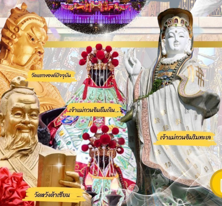
วัดแห่งองค์ปัจจุบัน