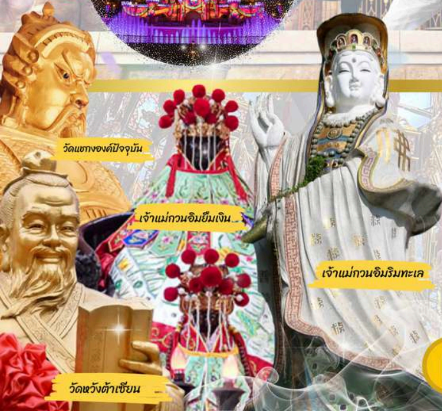
วัดแห่งองค์ปัจจุบัน