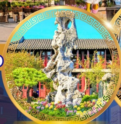
สวนหลิวหยวน

ถนนหนานจิงลู่ หาดไว่ทาน ชมหอไข่มุก ล่องเรือทะเลสาบซีหู ตำนานพญางูขาว เจดีย์เหลยเฟิง ถนนเสี่ยวเหอจือเจีย วัดหลงหยวน สวนหลิวหยวน ซุปป์ิง ถนนกวนเจียนเจีย ถนนซีหลี่ซานถึง วัดพระหยก เซคอินย่านเก่าซิ่นเทียนตี้ สักการะศาลเจ้าพ่อหลีกเมือง