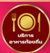
บริการ อาหารท้องถิ่น