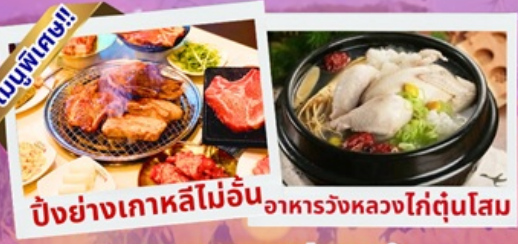
ปิ้งย่างเกาหลีไม่อื่น อาหารวังหลวงไก่ตุ๋นโสม