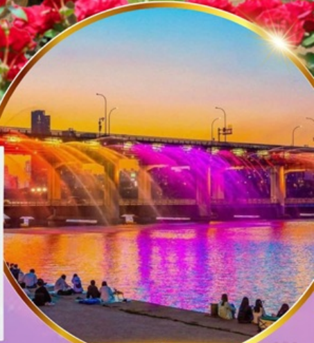
ชมสะพานน้ำพุสายรุ้ง