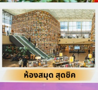
ห้องสมุด สุดชิค