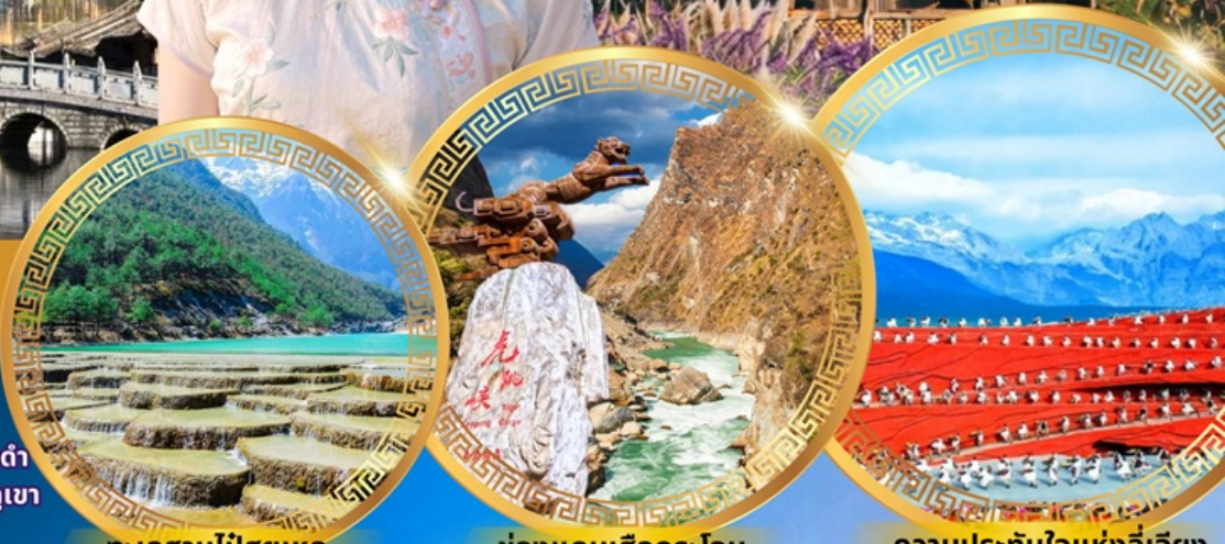
ทะเลสาบไป๋สือเหอ

พักโรงแรม 4 ดาว ★★★★★ ฟรี ประกันอุบัติเหตุ บริการอาหารท้องถิ่น