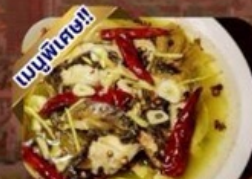
ปลาต้มพริกทอด