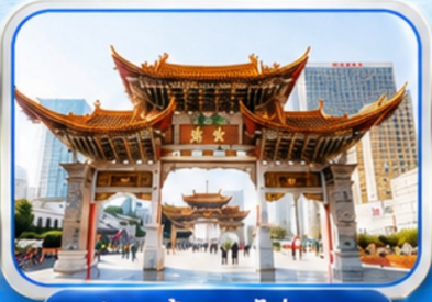
ประตูม้าทองโก่หยก