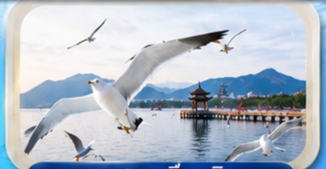
ทะเลสาบเตียนซิน