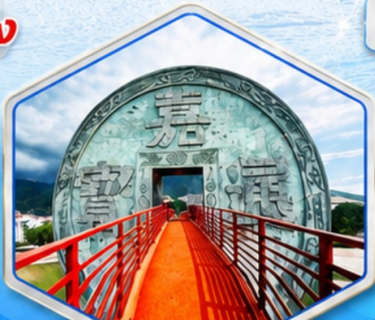
จตุรัสเหรียญโบราณ