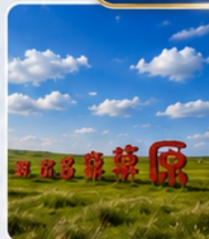
ทุ่งหญ้าออร์ดอส พิธีต้อนรับแบบชาวมองโกเลีย สวมชุดมองโกเลีย ปาตี้รอบกองไฟ