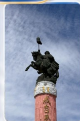
สวนสุสานเจงกิสข่าน (ชมด้านนอก)