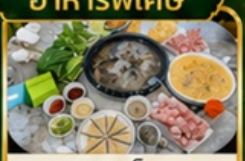
ชาปูเห็ด