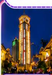
ตึกไครอิ่งไหลว