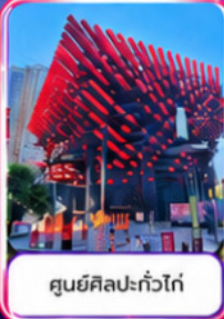
ศูนย์ศิลปะแก้วโก